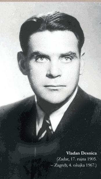
Vladan Desnica (Zadar, 17. rujna 1905. – Zagreb, 4. ožujka 1967.)