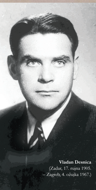
Vladan Desnica (Zadar, 17. rujna 1905. – Zagreb, 4. ožujka 1967.)