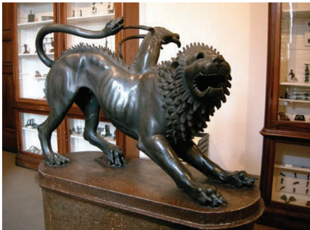
Sl. 4. Himera iz Arezza, bronca, lijevanje à cire perdue (5. – 4. st. pr. Kr., etruščanska umjetnost), Firenze, Museo archeologico nazionale

čudovište Himeru. Unuka Geje i Tartara, kći diva Tifona i zmije Ehidne, harala je stadi- ma i rigala vatru uništavajući okoliš, tako da je Argolidi prijetila glad. Usmrtio ju je junak Belerofont te kao opasna sjena živi u podzemnom svijetu među sjenama drugih čudovišta. Kompozitna neman (kombinacija koze, lava i zmije) najpoznatija je u obliku koji su joj dali etruščanski brončari. Oštećeni kip nađen je 1553. godine kod Arezza u ne baš posve jasnim okolnostima, a prvi ga je restaurirao Benvenuto Cellini za Cosima I. Medicija. 134 Danas je jedan od bisera arheološkog muzeja u Firenzi. U odlomku iz XIX. poglavlja Proljeća Ivana Galeba šimerom postaje sama zamisao o borbi protiv smrti, utjelovljuje se i opisana je nizom riječi koje pristaju bićima (šiknuti, staniče, pokuljati, propet, sokovi, sazdan od krvi i mesa) 135 i upravo prizivaju Himeru. 136