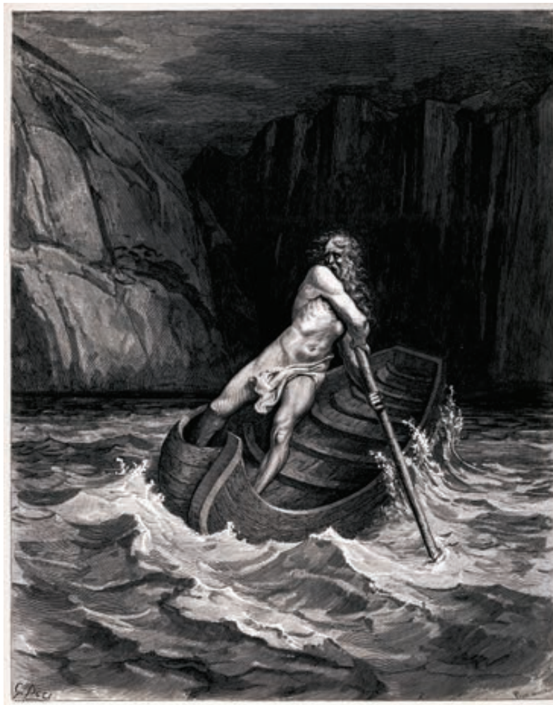
Sl. 5. Paul Gustave Doré, Haron , drvorez (1857.)

Evo i Harona groznog, vozara i vodi čuvara, halja mu gnusna je tralja, i sijeda ga obrasla brada, čupava, kuštrava, gusta; a očima vatrenim gleda, plašt mu se prljavi klati što u čvor ga sapeo sprijeda. Motkom otiskuje lađu i plovidbom upravlja njenom, duše preminulih vozi u čunu od rđe crvenom, star je, no bogu su sile i u starost krepke i čile. 138