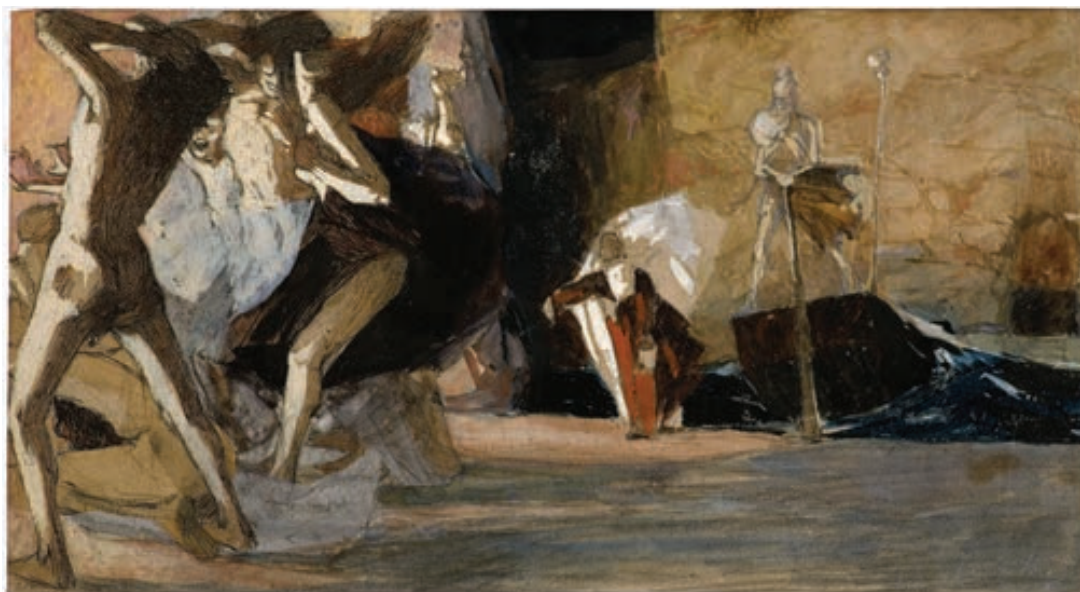
Sl. 7. Mirko Rački, S onu stranu Aheronta , tuš i akvarel na papiru (1907.), Galerija umjetnina, Split