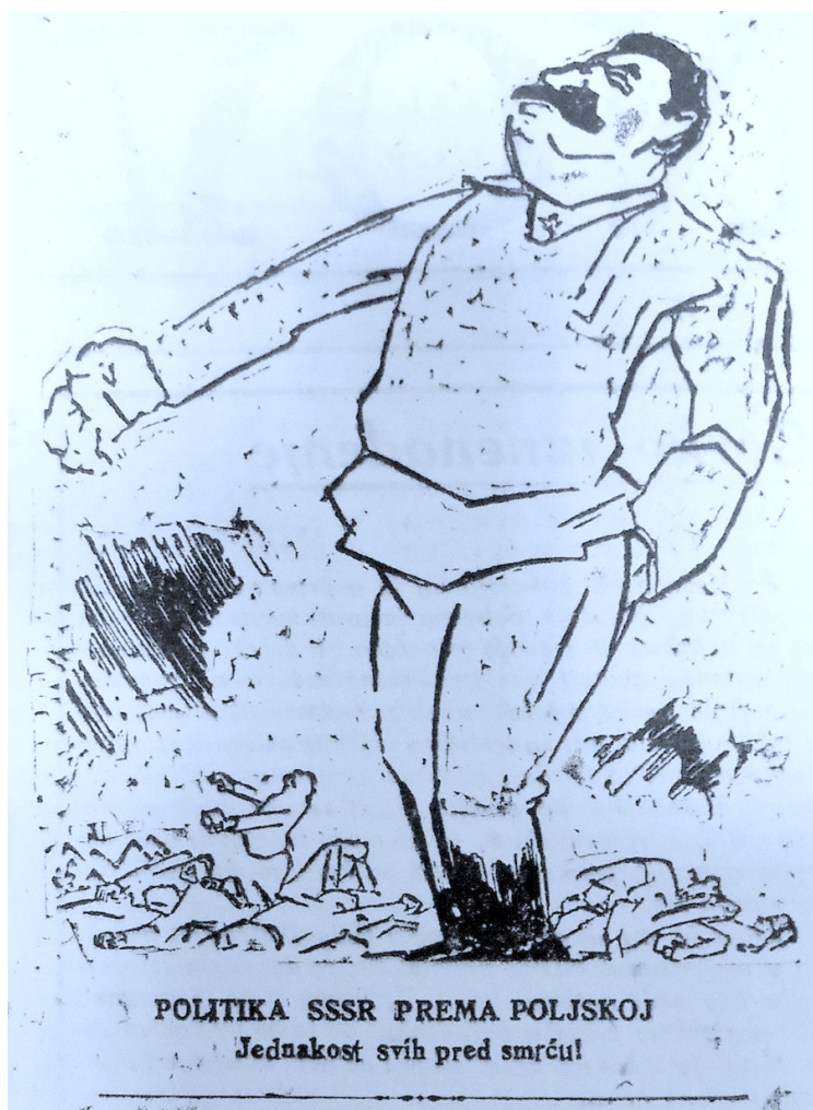
Sl. 1. Karikatura Staljina u Novom dobu kao komentar njegove ratne politike

Ipak, da kod Sibe Kvesića pri ocjenjivanju privrženosti širokih masa izvještavanju Slobodne Dalmacije nema previše uveličavanja, svjedoči i činjenica da je ustaški pokret amnestiju Ante Pavelića za partizane od 26. siječnja 1944. godine objavio lažnim brojem Slobodne Dalmacije – zapravo letkom – datiranim 29. siječnja 1944. i s pogrešnim brojem 29. 18 Moguće je primijetiti velik nesrazmjer između dva dnevnika, 19 koji ne treba čuditi upravo zbog posebnih i različitih uvjeta u kojima su djelovali. Utoliko je usporednu analizu sadržaja teže vršiti. Osim toga, sam sadržaj dvaju listova moguće je problematizirati kao unificiranu kategoriju za istraživanje u smislu da su razlike između novinarskih i uredničkih izbora ili pristupa – a ne samo ideološke ili svjetonazorske razlike – vrlo značajne. Snažan je naglasak u Novom dobu stavljan na vijesti s istočnih, talijanskih i, nakon ljeta 1944., zapadnih frontova – ove su vijesti dolazile iz novinskih agencija Sila osovine ili Hrvatskog dojavnog ureda, dakako, uz neizostavne ocjene o njemačkoj snažnoj i nepokolebljivoj obrani. 20 Naglasak na uspješnosti njemačkih obrambenih ili ofanzivnih nastojanja u Novom dobu samo se pojačavao nakon lipnja 1944. i iskrcavanja u Normandiji. 21 Dopisnička mreža Novoga