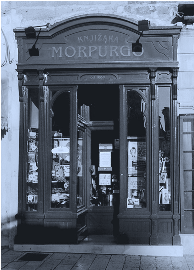
Sl. 1. Knjižara Morpurgo: od 1860. mjesto okupljanja splitskih pisaca, intelektualaca i gimnazijalaca

njemačkog, ruskog, poljskog, pa čak i japanskog! 9 O političkim pitanjima vezanim za Jadran Splićani često pišu i u zagrebačkim časopisima pa tako odvjetnik Josip Smodlaka piše o „Talijansko-južnoslovenskom sporazumu“ u Novoj Evropi . 10