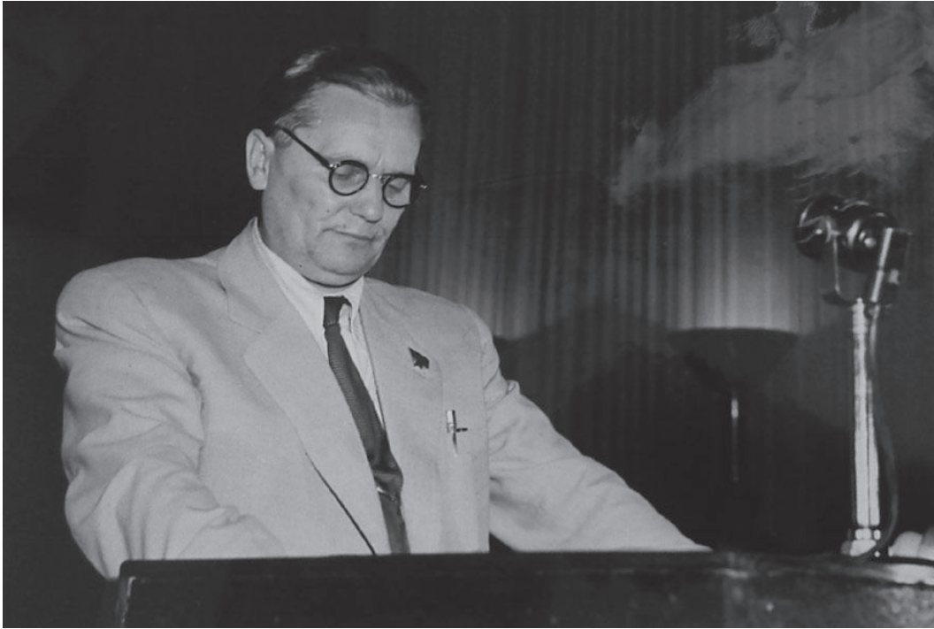
Slika 3. Josip Broz Tito čita referat na Petom kongresu KPJ

označivši to „revolucionarnim putem koji još nije dovršen”. Tu je tvrdnju u potpunosti razradio u vrijeme sukoba sa SSSR-om. 149