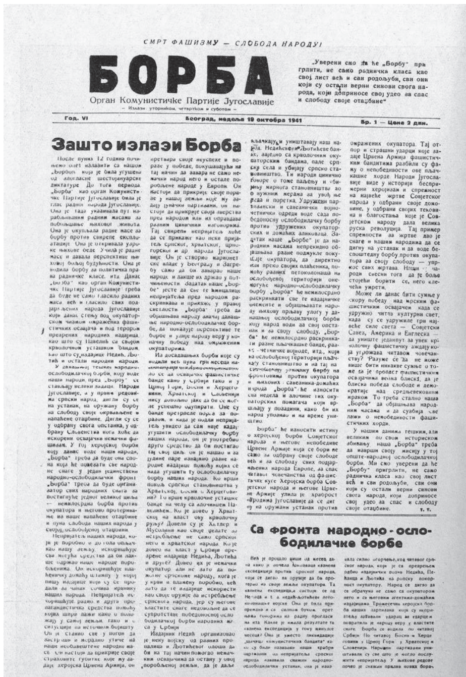
Slika 1. Faksimil prve stranice prvog broja Borbe , tiskan 19. listopada 1941. u Užicu, s uvodnim Titovim člankom „Zašto izlazi ‘Borba’”

Među prvim radovima u kojima je Tito pisao o Drugome svjetskom ratu nalazi se njegov politički referat na Petoj zemaljskoj konferenciji (jesen 1940.), koji se dobrim dijelom bavio upravo poviješću KPJ te jedan članak objavljen u glasilu CK KPH Srp i čekić . 18 Prvi tekstovi nastali nakon Travanjskog rata i okupacije Jugoslavije objavljeni su dok je Tito još boravio u Zagrebu i Beogradu. Radilo se o nekoliko članaka objavljenih u Proleteru (tekst o savjetovanju KPJ održanom u svibnju 1941. u Zagrebu koji, zanimljivo, nije bio uvršten