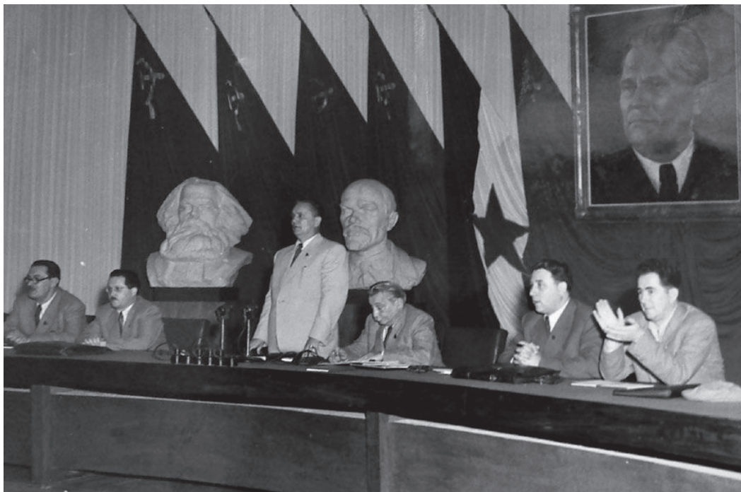
Slika 4. Peti kongres KPJ 1948. S desna na lijevo: Milovan Đilas, Aleksandar Ranković, Moša Pijade, Josip Broz Tito, Edvard Kardelj, Franc Leskošek Luka

odnosno ističe se kako su narodi Jugoslavije stupili u borbu i prije poziva Kominterne od 22. lipnja 1941. 158 Zašto je tomu tako, Tito je u referatu izravno i objasnio: